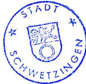
Dr. René Pörtl Oberbürgermeister

Es wird bestätigt, dass der Inhalt bzw. Wortlaut der vorstehenden Satzung vom Gemeinderat in seiner öffentlichen Sitzung am 19.11.2015 beschlossen wurde und dabei die gesetzlichen Verfahrensbestimmungen eingehalten worden sind.